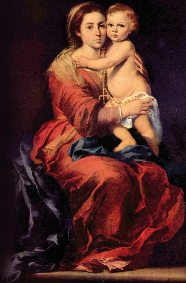
Virgen del Rosario, Murillo

AMFAR les desea una feliz Navidad y un próspero año nuevo